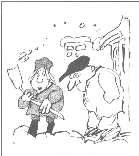
Prioritäten bei der Zuteilung von Mangelwaren: «Wenn nur eine einzige Schneeschaufel vorhanden ist, übergibt man sie selbstverständlich der Dame.» («LM», 28. 1. 1987)

viel, und nach ein paar Jahren wurde dieser Teil der Übung wieder abgeblasen.