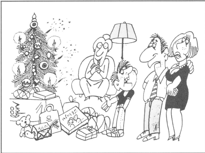
«Da habt ihr aber dem Christkind dieses Jahr viel Schmiergeld geben können.» («LM», 24. 12. 1986)

Die Direktoren der meisten Industrie-, Handels- und Agrarbetriebe werden heute nicht mehr vom Ministerium oder von der zuständigen Territorialbehörde ernannt, sondern von einem Unternehmensrat aus Belegschaftsvertretern auf fünf Jahre gewählt. Das gleiche Gremium bestimmt auch seinen Lohn und hat ihm gegenüber somit Arbeitgeberrechte. Für die praktische Betriebsführung trägt der Direktor immerhin weiterhin die alleinige Verantwortung.