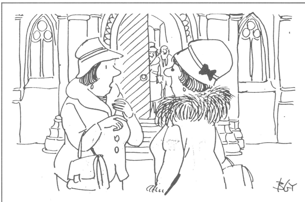
Für eine Auslandsreise braucht es Devisenzuteilung, und hier kommt es zum verblüffenden Anwendungsfall: «In welchen Jahren erhält der Papst eigentlich Zlotys für seine Polenreise?» («LM», 21. 1. 1987)

Neu ist die Möglichkeit, dass insbesondere bei kleineren Betrieben die leitenden Angestellten direkt oder indirekt von den Belegschaften gewählt werden.