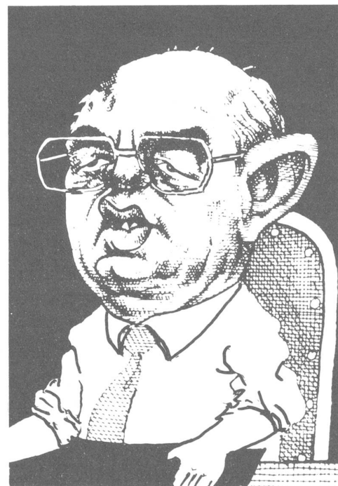
Karikatur «sta vast», Berkel en Rodenrijs, NL

«Auf einer bestimmten Etappe begann das Land an Entwicklungstempo zu verlieren. Es begannen sich Schwierigkeiten und ungelöste Probleme zu häufen, es kam zu Stagnations- und anderen, dem Sozialismus fremden Erscheinungen... Die negativen Prozesse beeinträchtigten die soziale Sphäre erheblich. Wir lösten erfolgreich die Fragen der Beschäftigung der Bevölkerung und sicherten die sozialen Garantien grundsätzlichen Charakters, konnten aber gleichzeitig die Möglichkeiten bei der Verbesserung der Wohnverhältnisse, der Versorgung mit Lebensmitteln, der Organisation des Transportwesens, der medizinischen Betreuung, der Bildung und bei der Lösung einer Reihe anderer vordringlicher Probleme nicht vollständig realisieren... Die in den letzten Jahren aufgekommenen Elemente der sozialen Korrosion wirkten sich negativ auf die geistige Haltung der Gesellschaft aus... Bei der