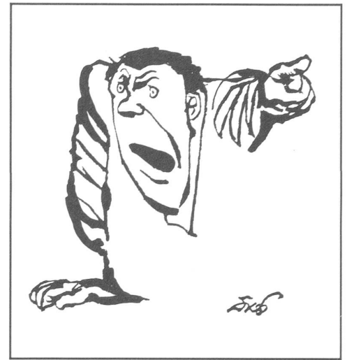
«Was heisst das schon, dass er die Wahrheit sagt, wenn diese Wahrheit gegen uns ist?» («Polityka», Warschau, 31. 1. 1987)

Die folgenden Zitate entnehmen wir einem Aufsatz, der in der Vierteljahreszeitschrift «Kontinent», Bonn, Nr. 1/1987, erschienen ist.