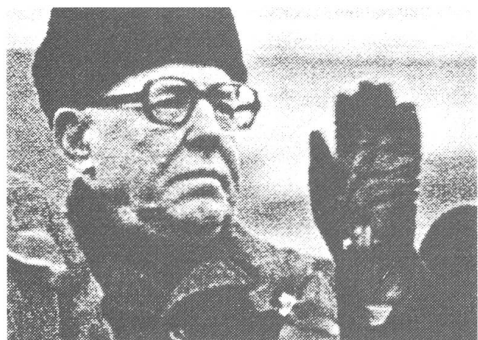
KGB-Chef Tschebrikow desavouierte lokalen KGB-Boss, der sich sicherheitsdienstlich benahm.

Starke Strömung und Gegenströmung also, wie es bei einer Gratwanderung unter den Bedingungen einer vielleicht sich lockernden Diktatur kaum anders zu erwarten ist. Doch welcher Stellenwert kommt der Strömung zu?