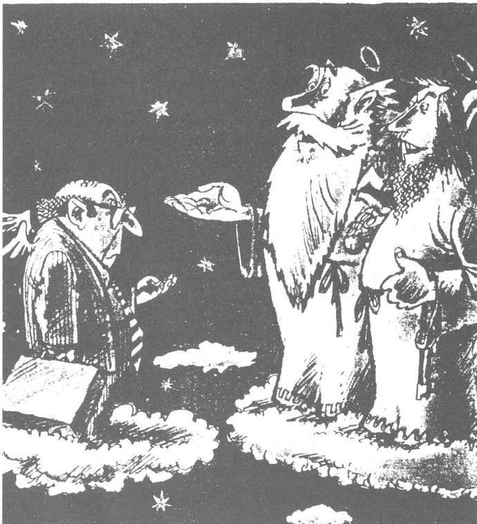
Oben: «Und wie ist denn der da hergekommen?» – «Er hat versucht, die Annahme eines Trinkgelds zu verweigern, und das hat sein Herz nicht ausgehalten.» («Krokodil», Moskau, Nr. 1/1987)

In aussenpolitischer Hinsicht sind die zwei Gipfeltreffen und besonders das zweite von Reyk-