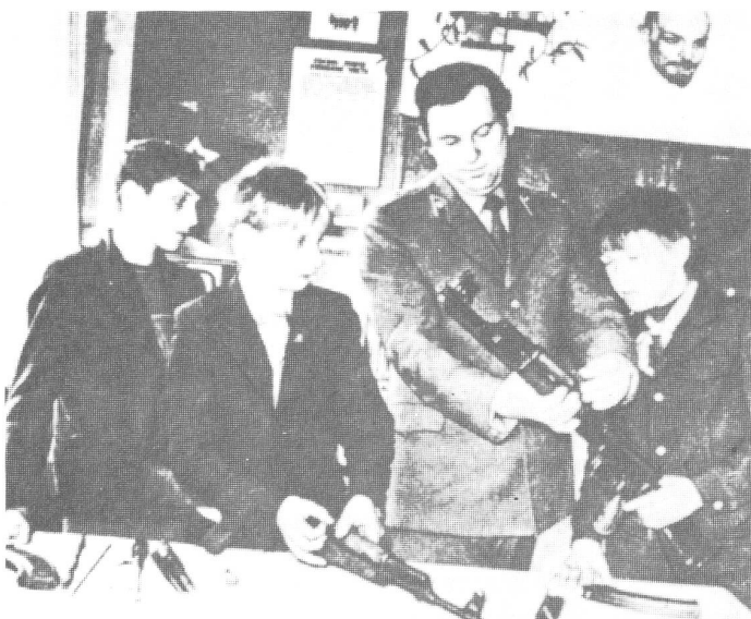
Ändert nur der didaktische Stil oder auch der Gegenstand? Militärvaterländischer Unterricht an einer sowjetischen Schule.

Gorbatschow kam nicht unerwartet, aber trotzdem eher unvorbereitet an die Macht. Nach Andropows Tod war Tschernenko bloss eine