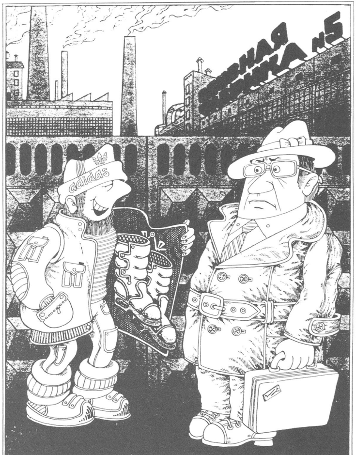
Rechts: Schwarzhändler mit Importschuhen zum Direktor der Schuhfabrik: «Und Ihnen, Genosse Direktor, mache ich einen Vorzugspreis. Wenn Sie nicht wären, käme ich ja schliesslich nicht zu meinem Einkommen.» («Krokodil», Nr. 1/1987)