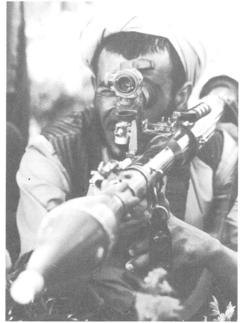
Soll er sich nicht wehren dürfen?

Der Druck muss sehr hoch sein, da der Schaden im Falle eines Abzugs ohne Sieg für den Kreml vorerst nicht abzuschätzen ist. Der so-