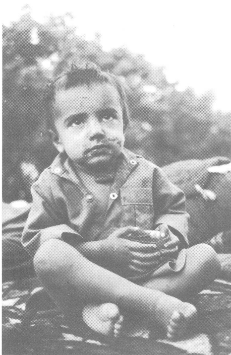
Afghanisches Kind.