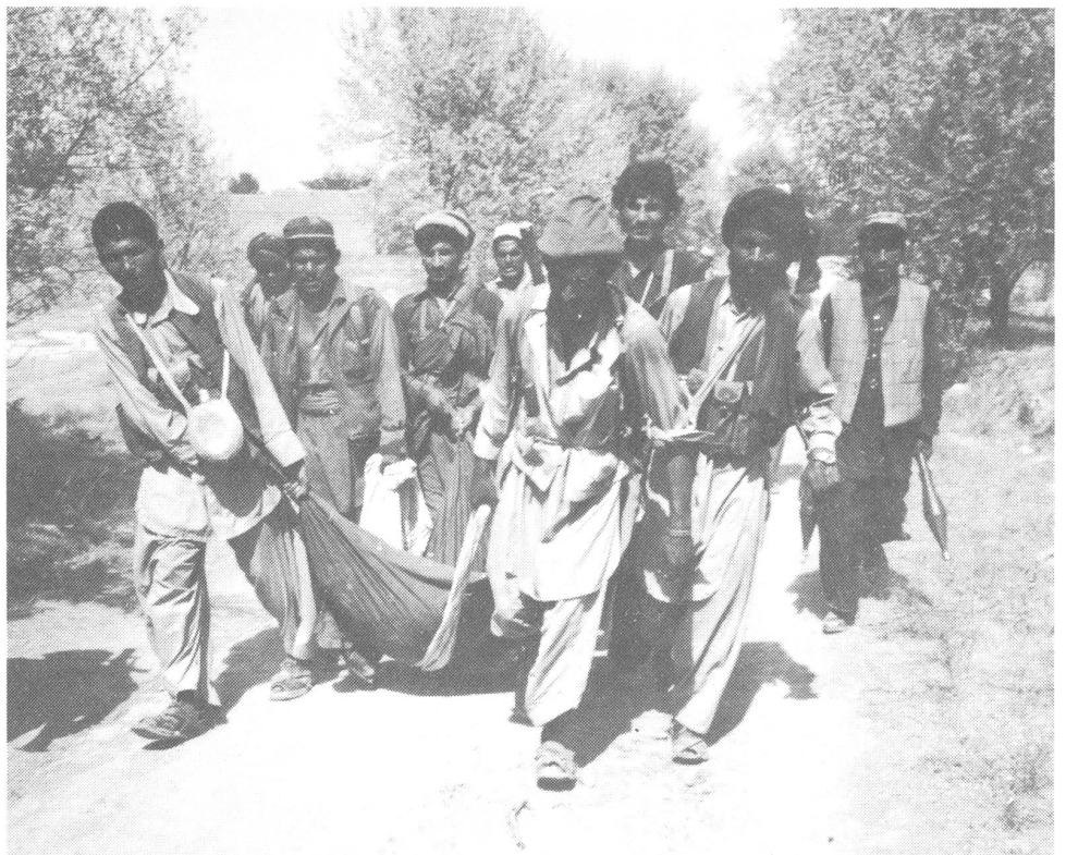
Mujahedin tragen einen gefallenen Kameraden zurück.

In der kommunistischen Demokratischen Volkspartei (oder Volksdemokratischen Partei) gibt es die alte Rivalität zwischen zwei Flügeln,