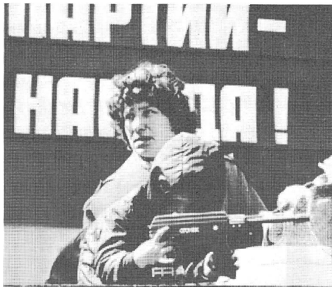
Spielzeug in Moskau.

Das ist Feminismus im Sozialismus, und das ist zivile Erbauung im Land, das laut Eigendarstellung das Friedenslager anführt. ■