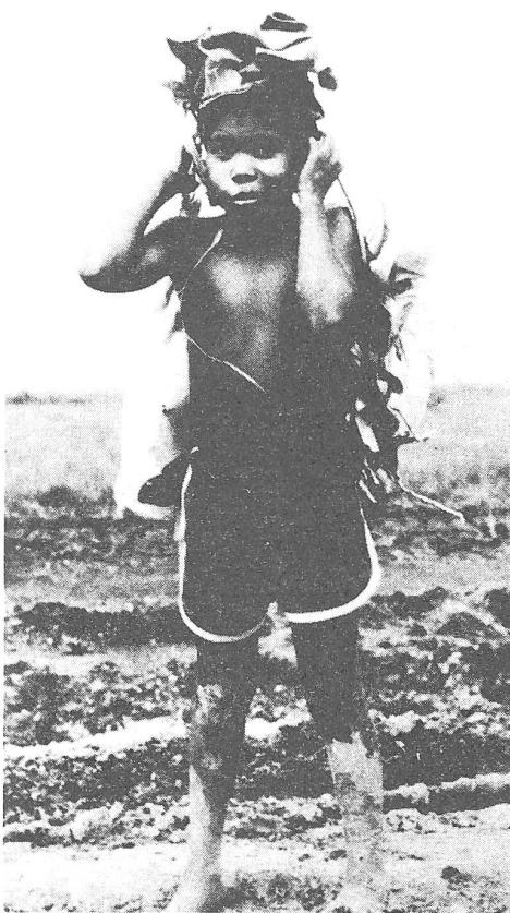
Miskitobub. Den bewaffneten Widerstand gegen das sandinistische Regime begannen die verfolgten Indianer. Wer stellt sich das hier vor?

lungshelfer ist ein Beweis dafür, wie eine Operation zwischen Nord- und Südfront ausgeführt werden kann.