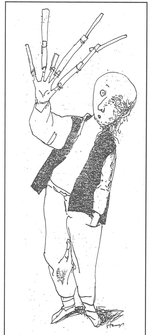
Ohne Worte. («Polityka», Warschau, 19. 4. 1986.)

Das Vorgehen der Behörden insgesamt hat keine klare Linie. Für propagandistische