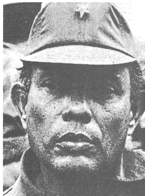
Innenminister Borge: Folterdienst als Lebensfreude.

Im Kampf gegen die Kirche muss natürlich auch der CIA herhalten. Radio Havanna äusserte sich am 24.2.86 wie folgt: «Der Unterschied zwischen dem Erzbischof von Managua und einem Agenten des CIA besteht lediglich in der Kutte.» Das Zitat wurde gleichentags von der Zeitung «El Nuevo Diario» in Managua abgedruckt. Das sind alte Platten, die immer neu aufgelegt werden. Am 9.7.52 hatte Walter Ulbricht diesen Ton schon angeschlagen: «Die Kirche der DDR muss sich entschieden lossagen von allen amerikanischen und englischen Agenten.» Anfang Mai 1986 wurde das katholische Sozialwerk der Erzdiözese Managua, «Coprosa», von der sandinistischen Regierung enteignet. Die von der deutschen Bischofskonferenz geschenkten Druckmaschinen sollen inzwischen einer regierungsfreundlichen