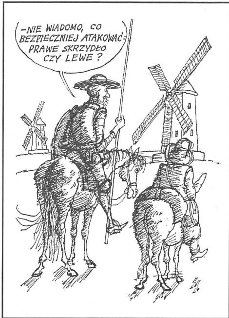
«Was man nicht weiss: Ist es sicherer, den rechten Flügel anzugreifen oder den linken?» («Polityka», Warschau, 6. 9. 1986)

der Studenten aufbrachten, die «schwer zu sagen» ankreuzten, ist auch schwer zu sagen.