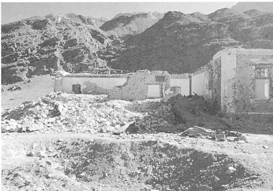
Das Spital in Doab nach seiner Zerstörung durch eine gezielte Bombardierung am 28. 5. 1984.