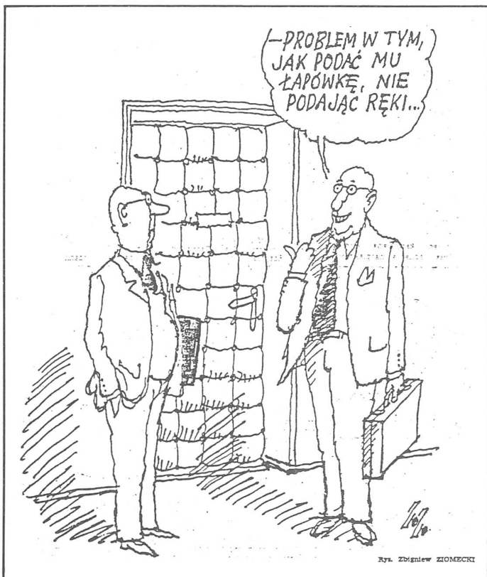
«Das Problem ist, wie ich ihm das Schmiergeld geben soll, ohne ihm die Hand zu geben.» (12. 7. 86)