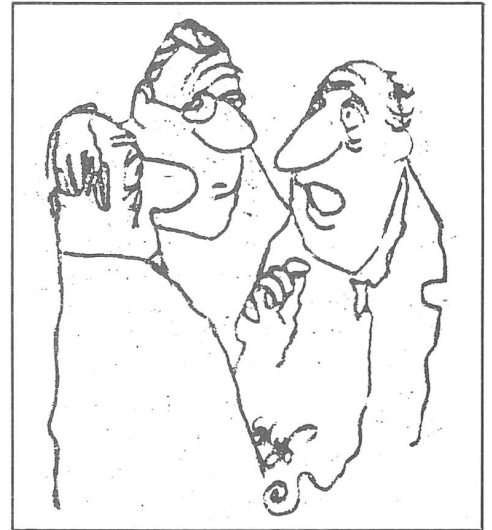
«Also, wer von uns soll jetzt ehrlich sprechen, wer kühn und wer kritisch?» (19. 7. 86)