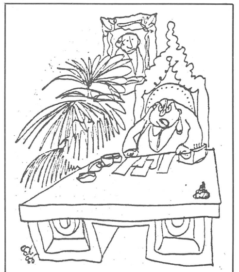
«Nein, ich bin der Beauftragte zur Förde- rung der Kultur und nicht zur Belieferung der Geschäfte für Künstler.» (3. 5. 86)