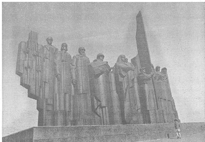
Ehrenwache von Jungen Pionieren und Kriegerdenkmal (von denen es in Woronesch mehrere gibt).