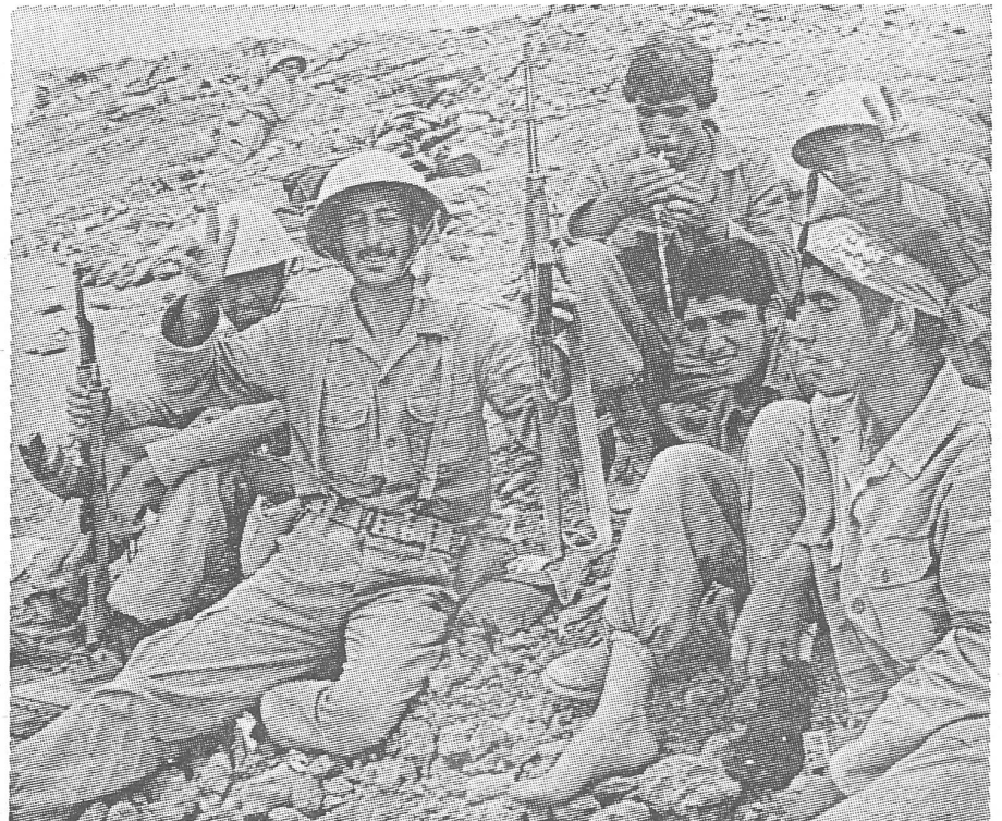
Iraker (links) und Iraner im Krieg.