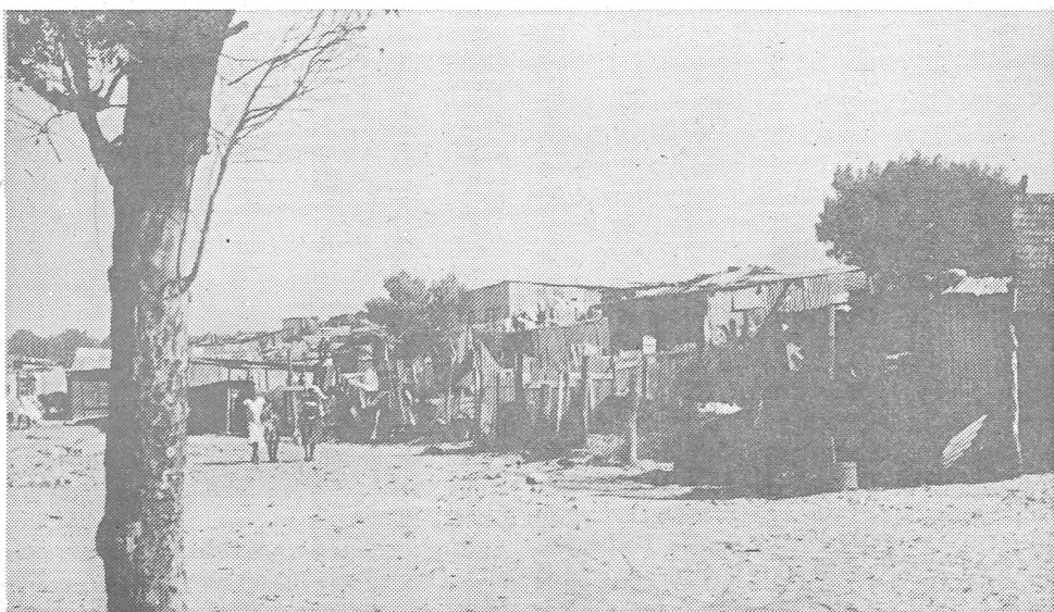
Cross roads, das Quartier blütiger Zusammenstösse in Kapstadt.

Die Regierung lässt die «Genossen» weitgehend einfach gewähren; anscheinend hat sie bereits keine andere Wahl mehr. Die Konse-