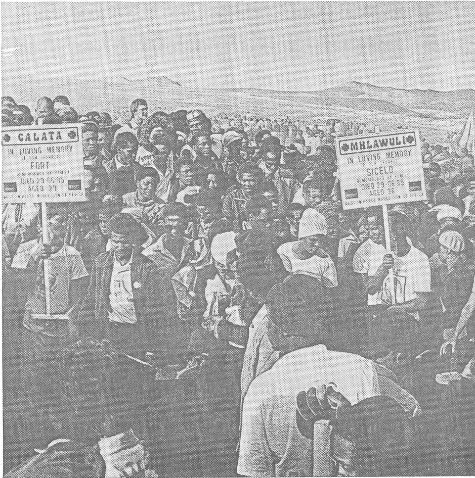
Trauerkundgebung für die Opfer von Unruhen.

ment überhaupt. Anfänglich kämpfte er (mit friedlichen Mitteln) um «gleiche Rechte» für die Schwarzen, vor allem in den Städten. Nachdem 1960 bei Zusammenstößen mit der Polizei in Sharpeville bei Johannesburg 69 schwarze Demonstranten getötet worden waren, proklamierte der ANC den gewaltsamen «Befreiungskampf». Die Bewegung wurde in Südafrika verboten und verlegte ihr Hauptquartier in die sambische Hauptstadt Lusaka. Inzwischen sind ihre Partisanentruppen zu einem wichtigen Machtfaktor in Südafrika geworden.