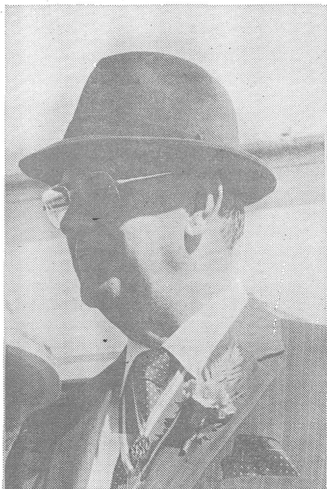
Mit halben Reformen zwischen Stuhl und Bank: der südafrikanische Präsident Pieter Botha.