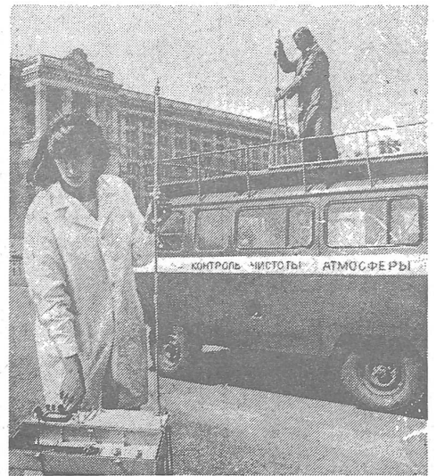
Mit nahezu zweiwöchiger Verspätung: Kontrolle der Luftverseuchung in Kiew. In den ersten Tagen unterliess man Vorsorgemassnahmen, weil man die Einwohner nicht aufklären wollte.