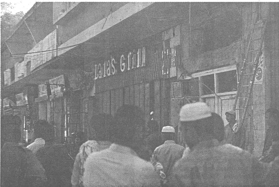
Nach einem Sprengstoffanschlag in Peshawar.

Überhaupt, das ganze afghanische Erziehungswesen ist jenem der Sowjetunion angepasst