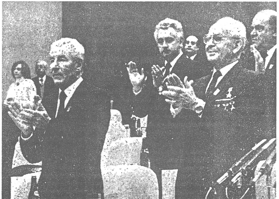
Links der Sowjetdelegierte Solomenzew, rechts Husak.

Der Kongress wählte ein neues Zentralkomitee und eine neue Parteiführung aus Reformern – genau wie das auch am 9. September der Fall gewesen wäre. Die Gremien wurden von Regierung und Nationaler Front anerkannt. Erst im September 1969, fünf Monate und zwei Plenumsitzungen nachdem Gustav Husak die Nachfolge Dubčeks angetreten hatte, wurde