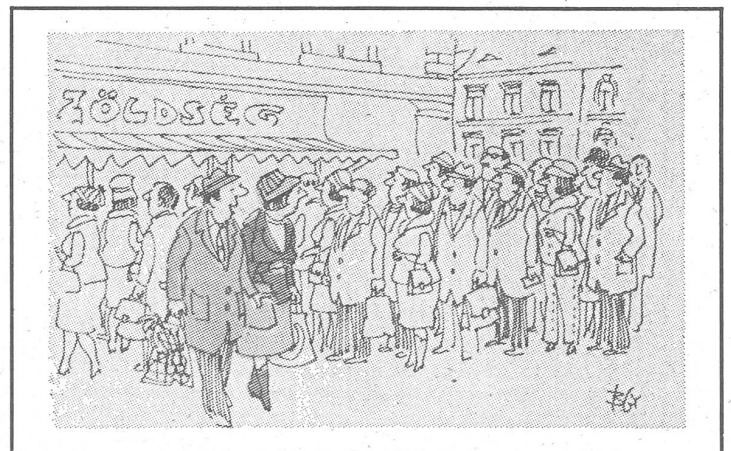
Oben: «Wenn die Leute imstande sind, für Bananen anzustehen, dann haben sie immer noch Geld übrig.» («Ludas Matyi», LM, Budapest, 2. 4. 1986)