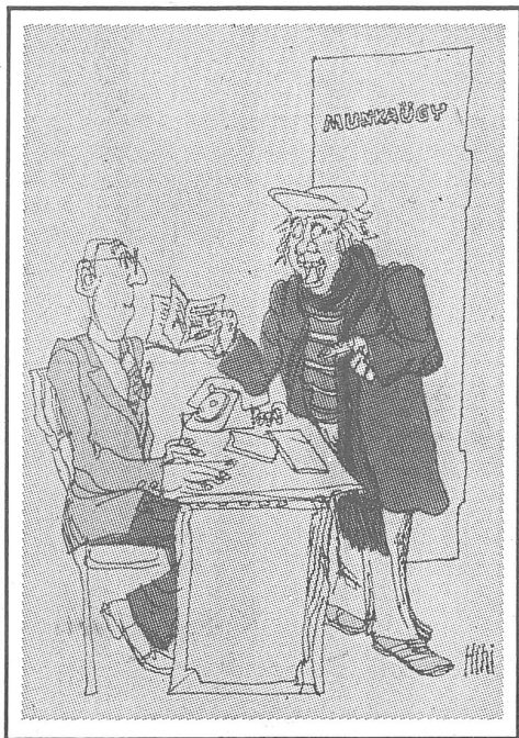
Beim Arbeitsvermittlungsamts. «Meine Ausbildung? Sechs Jahre Primarschule plus zwei Spezialkurse für Alkoholentziehung.» (LM, 5. 2. 1986)

In den Spitälern für Privilegierte erhalten die Ärzte kein Dankbarkeitsgeld in bar; hingegen werden sie bei der Wohnungsvergabe bevorzugt, ebenso bei der Zuteilung von Devisen und der Möglichkeit zu Auslandsreisen.