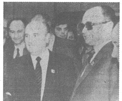
Jaruzelski bei Gorbatschow.

Nun hat man Gerüchte dieser Art schon früher gehabt, und weil die Sowjets ihre Unzufriedenheit mit dem Gang der «Normalisierung» in Polen schon öffentlich bekundet haben, ist die personelle Ausrichtung auch nicht schwer zu