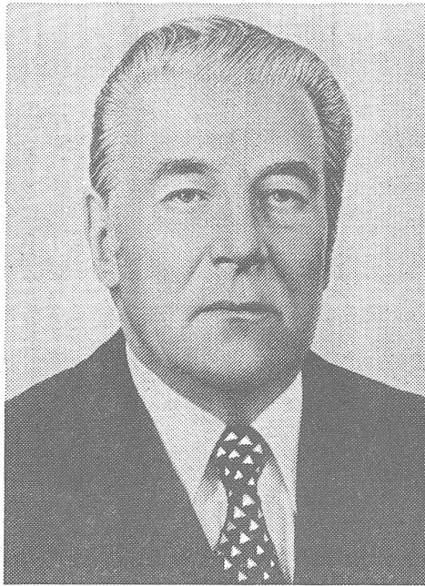
Politbüromitglied Michail Solomenzjew: Die Parteikader betrügen ungestraft den Staat.

Der neue Moskauer Parteichef Boris Jelzin in seiner Rede vom 25. Februar vor dem Parteitag. «Prawda», 27. 2. 1986