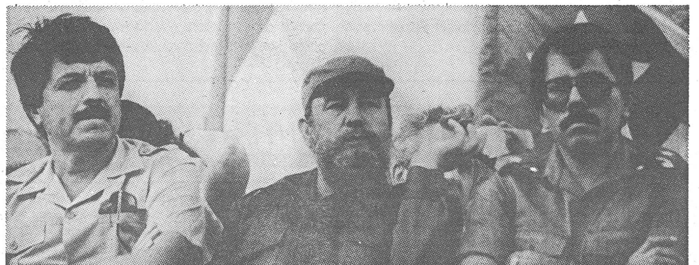
Daniel Ortega (rechts) nach seinem Wahlbetrug bei der Inauguration als Präsident Nicaraguas vor einem Jahr. Mitte Fidel Castro, links Vizepräsident Sergié Ramirez.

Rechtens wäre Marcos ein Expräsident, aber er klammert sich an die Macht, die ihm die Mehrheit abgesprochen hat. Es gibt für Demokraten keinen Grund, ihn in seinem illegalen Anspruch zu unterstützen, und ohne auswärtige Unterstützung wird sein Regime zusammenbrechen, das heisst, noch rascher zusammenbrechen.