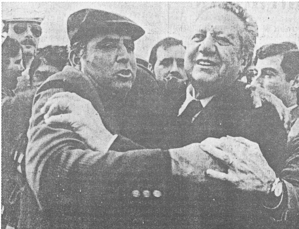
Mario Soares in der Siegesfreude.

Das könnte stimmen, und Mario Soares kommt das Verdienst zu, wesentlich dazu beigetragen zu haben, dass den Kommunisten in der «wilden Revolutionsphase» der Zugriff zur Alleinmacht misslang. Seit 1976 bekleidete Soares dreimal das Amt des Ministerpräsidenten, zuletzt in Koalition mit den (liberalen) Sozialde-