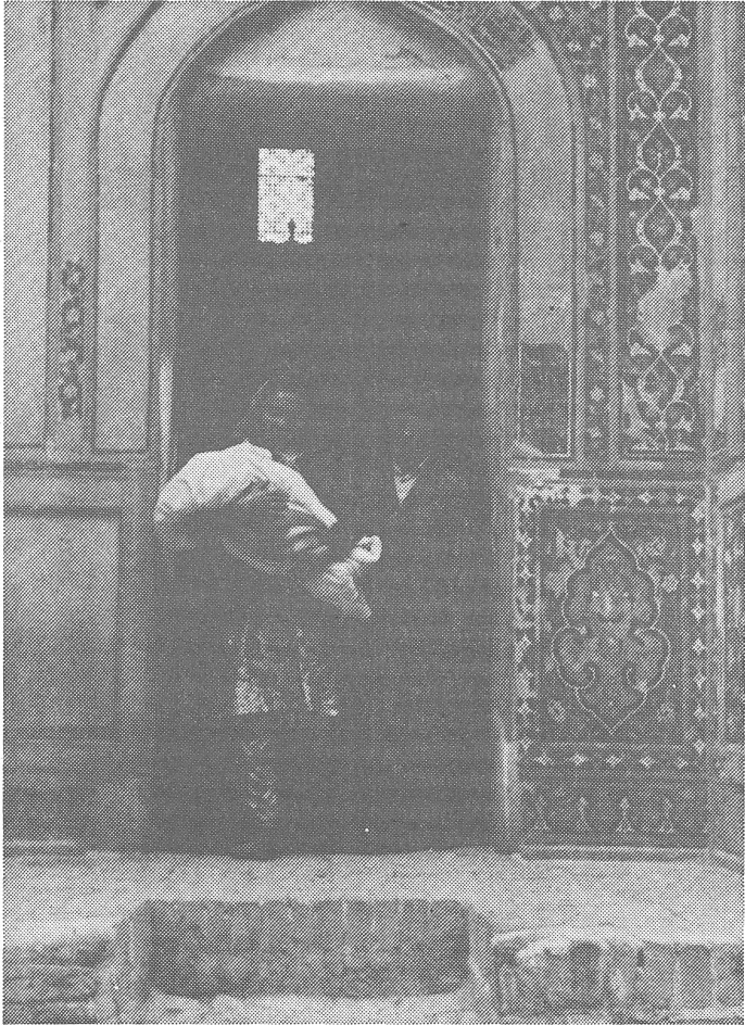
Kirchensegen für Kindersegen. Ein Elternpaar, das mit dem Kind zu den heiligen Stätten von Samarkand gepilgert ist.

Fanatismus das Bewusstsein sowjetischer Bürger angreift, so wie der Rost das Eisen.»