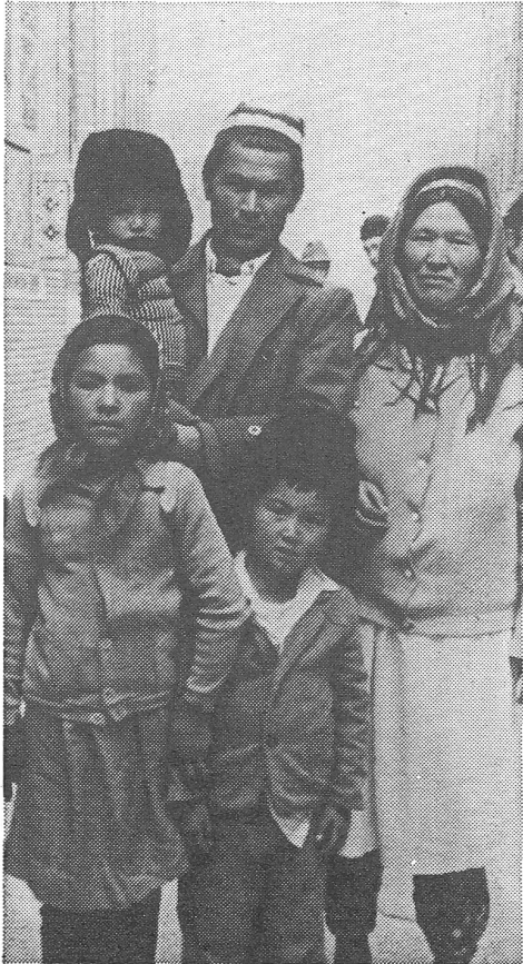
Ein besonderes Problem in Zentralasien ist die gegenüber andern Unionsgebieten grössere Zuwachsrates der Bevölkerung. Usbekische Familie mit einem Teil ihrer Kinder.

Sowjetische Medien stellen ungehalten fest, dass religiöse Radiosendungen aus islamischen Staaten auf eine wachsende Zuhörerschaft in den zentralasiatischen Republiken der UdSSR rechnen können.