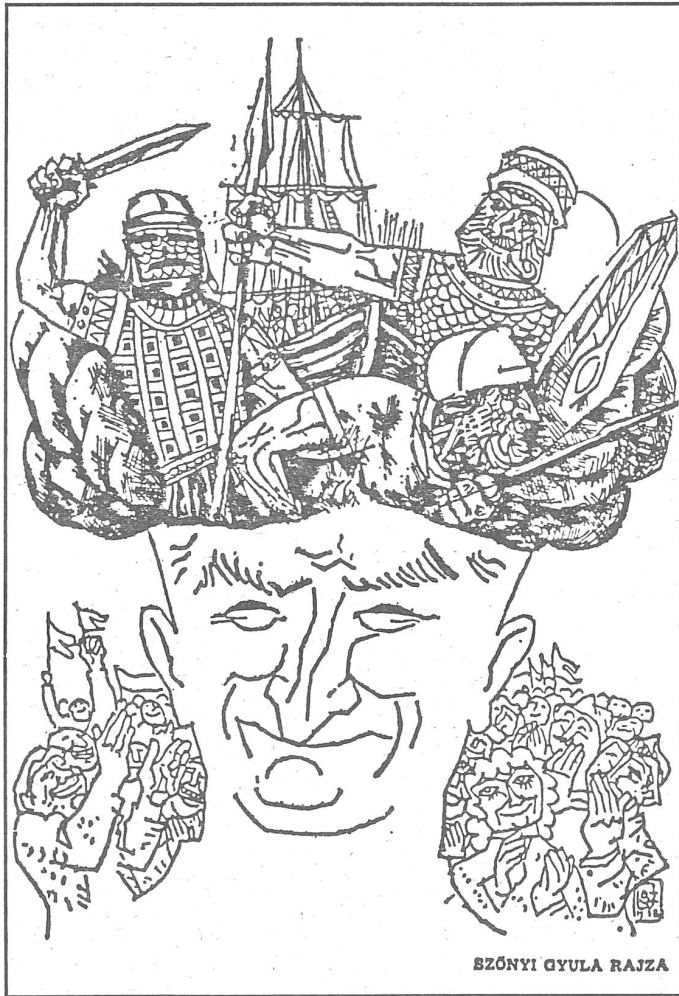
Der Blut-und-Boden-Mythos des Dritten Reiches findet sich abgewandelt in Rumänien. Geradezu ein Unikat ist die ungarische Spottkarikatur auf den rumänischen Staats- und Parteichef Ceaușescu. Sie verspottet als Hirngespinnst seine Theorie über die Daker (Volk im Altertum) als erste rumänische Nation. Auch deutet die Zeichnung an, dass dieser Geschichtsmythos zur Aufheizung des Nationalgefühls gebraucht wird. («Nepszabadsag», Budapest, 13. 3. 1982)

in Bulgarien, die Verherrlichung der alten Daker und ihres Königs Burebista in Rumänien und verwandte «archäologische» Zufluchten. Diese werden immer bizarrer und grotesker, wie die Erhebung des legendären Vampir-Grafen Dracula zum patriotischen Vorbild in Rumänien oder die Stilisierung Dschingis Khans zum Kulturheros in der Mongolischen Volksrepublik.