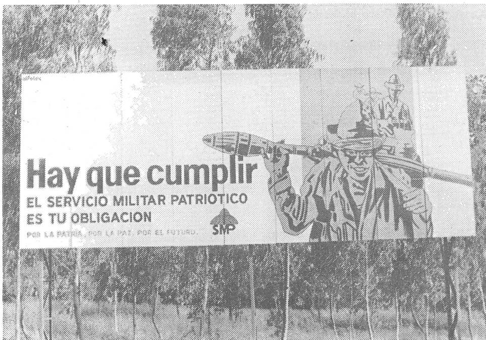
«Die Erfüllung des patriotischen Militärdienstes ist deine Pflicht.» Propagandawand in Managua.

Besonders bemerkenswert ist in diesem Zusammenhang der genuin faschistische Rückgriff in immer tiefere Vergangenheiten, ja sogar auf halbmythische Frühzeiten. So entsprechen dem Kult des Imperium Romanum unter Mussolini und der nationalsozialistischen Germanentümelei die Wiedereinsetzung des alten heidnischen Pferdeschwanzes als nationales Emblem