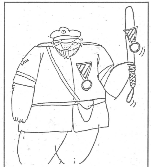
Orden für den Sozialismus. Am 11. Dezember 1981 erschien in Warschau die 37. und letzte Nummer von «Tygodnik Solidarnosc», der Wochenzeitung der unabhängigen Gewerkschaft. Mit dieser Karikatur.

Der Kommunismus kann noch überleben, sein Niedergang mag sich jahrzehntelang hinziehen und das Ende sogar schrecklich sein. Doch der Anfang vom Ende hat begonnen. Wir haben uns darauf nüchtern einzustellen. ■