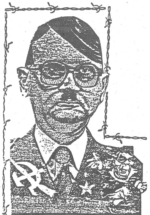
Adolf Jaruzelski. Eine exilpolitische Karikatur. Die militärische Machtergreifung unter expliziter Ausrufung des Kriegszustandes, wie sie 1981 stattfand, ist sicherlich keine ideologiegerechte Erscheinung in einem sozialistischen Land. Aber sie ist symptomatisch für das Abdriften in den «ganz gewöhnlichen Faschismus», nachdem die ideologischen Glaubensinhalte abhanden gekommen sind.

Mit anderen Worten: der Faschismus tauchte erst nach dem Kommunismus auf. Er ist in seinem Wesen eine «Reaktion» auf den Kommunismus, den er bekämpfte. Er bekämpfte ihn jedoch mit Methoden, die er zum grössten Teil