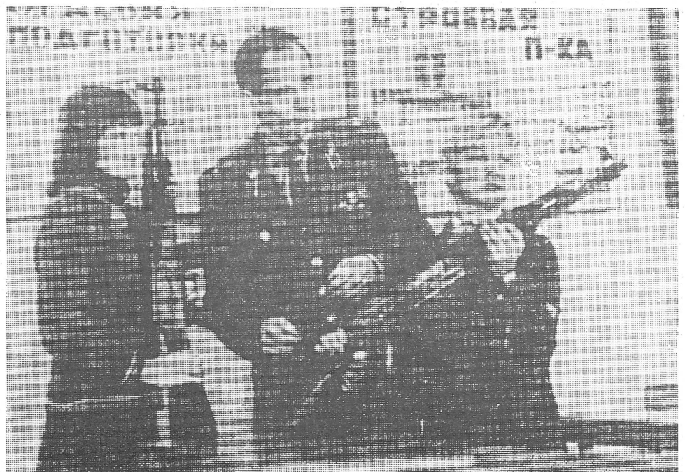
Militärpatriotischer Unterricht in der Sowjetunion (hier 1983 in der Stucka-Sekundarschule von Riga: Ausbildung am Kalaschnikow-Sturmgewehr).

Spätkommunismus als Metamorphose des Faschismus – dabei handelt es sich, vorläufig wenigstens, nur um Tendenzen der Annäherung, doch immerhin ist diese Entwicklungslinie überaus kräftig. Vieles spricht dafür, dass die faschistisch-nationalsozialistische Strömung in den verschiedenen kommunistischen Ländern