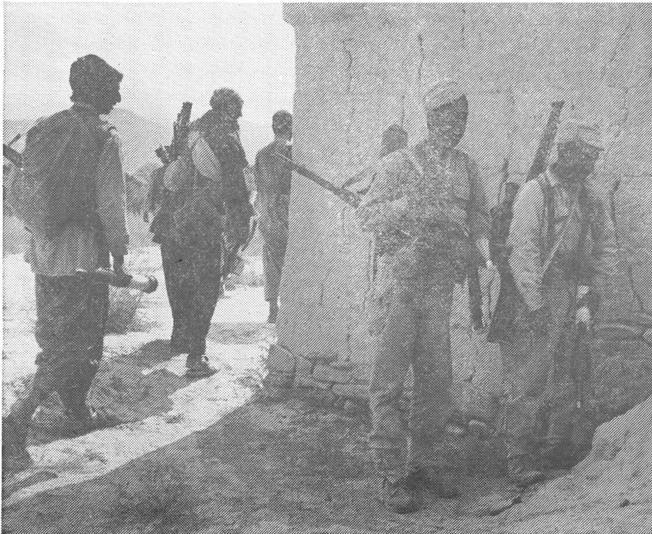
Gefangene afghanische Regierungssoldaten. Die Mujahedin haben ihnen ihre geladenen Waffen belassen (!).