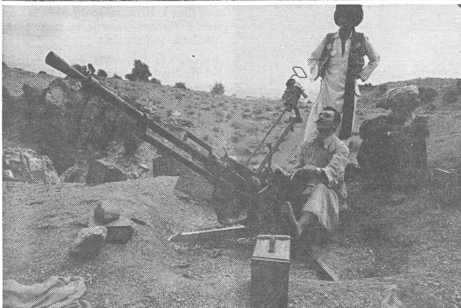
Die Mujahedin verfügen heute zum Teil über moderne Waffen. Oben: Ein erbeuteter Spähpanzer vom Typ BRDM. Mitte: Eine Stalinorgel aus China. Die Reichweite ihrer Geschosse beträgt 8 km. Unten: Schweres Maschinengewehr zur Fliegerabwehr. Indessen fehlt es den Partisanen an wirksamen Waffen gegen die gepanzerten Helikopter und gegen die Kampfflugzeuge. Alle Photos zu diesem Beitrag vom Autor.

sie lachen gerne und oft – trotz des Krieges. In den Händen halten sie den Lauf ihrer Kalaschnikow, und manch einer blättert in einem kleinen Buch, dem Koran.