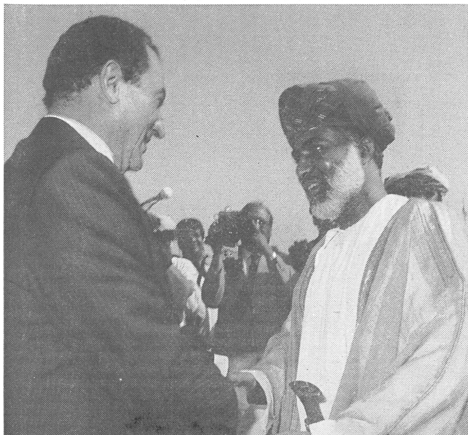
Blockfreie Solidarität. Des Sultans Händedruck mit dem ägyptischen Präsidenten Mubarak.