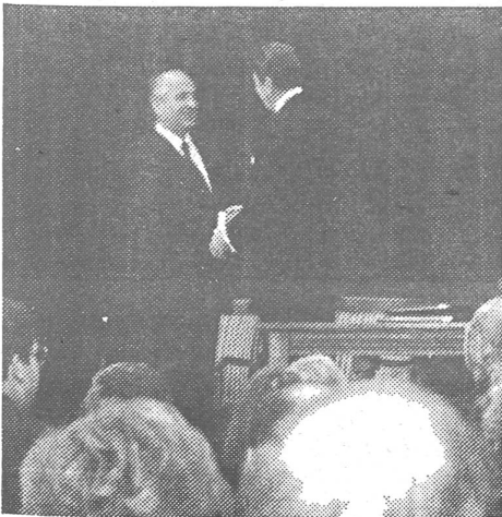
Der Händedruck wird erst gelten, wenn auch die Vorzeichen stimmen.

Vermutlich hat Reagan dies seinem Gegenüber in Genf deutlich gemacht. Ob der neue Kremelchef es mit der Verbesserung der Beziehungen zu Washington wirklich ernst meint, lässt sich bald in Afghanistan und bei den diversen regionalen Konflikten sehen, wo Moskau mitmischet. Wenn Gorbatschow nächstes Jahr in die USA reist, wird er auf diese Fragen antworten müssen. ■