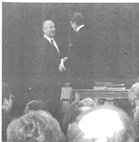
Der Händedruck wird erst gelten, wenn auch die Vorzeichen stimmen.

Vermutlich hat Reagan dies seinem Gegenüber in Genf deutlich gemacht. Ob der neue Kremelchef es mit der Verbesserung der Beziehungen zu Washington wirklich ernst meint, lässt sich bald in Afghanistan und bei den diversen regionalen Konflikten sehen, wo Moskau mitmischet. Wenn Gorbatschow nächstes Jahr in die USA reist, wird er auf diese Fragen antworten müssen. ■