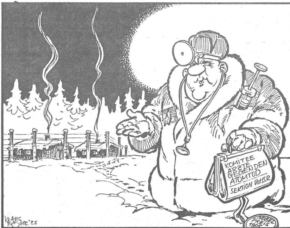
Karikatur «Die Welt», Hamburg: «Der Frieden hat auch hier seinen Preis.»

Anderen Leuten mag genügen, dass Tschasow in der Sowjetunion Ärzte um sich schart, die –