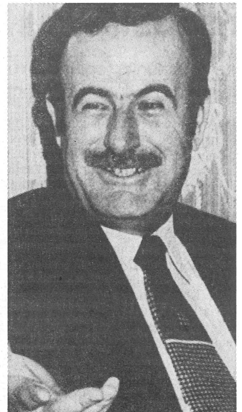
Der syrische Diktator Assad.

Als Garant für dieses schöne Programm bietet sich die syrische Schutzmacht an, die ihre eigenen Truppen im Lande stehen hat. Aber weder sie noch ihre libanesischen Schützlinge sind fähig oder willens, das Programm in die Tat umzusetzen.