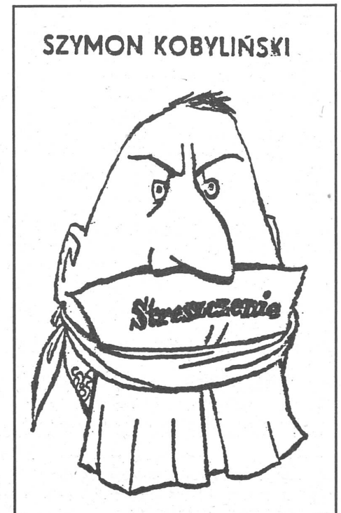
«Kurzfassung». («Polityka», Warschau, 29. 6. 1985)

Auschwitz und Birkenau, um nur zwei Namen zu nennen: Dort ist noch heute auf jeder Stufe, auf jeder Wand und in den unheimlichen Zellen des Todes das Kalvarium eingemisselt.