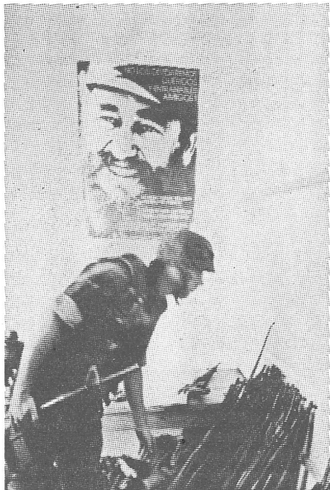
Für Radio DRS ein Grund zur Anfeindung in jeglichen Formen: die Landung der schon längst wieder abgezogenen amerikanischen Truppen in Grenada. Hier ein amerikanischer Soldat nach der Invasion von 1983 bei der In-spezierung eines Waffendepots.

Wie sieht es aber aus, wenn man wieder einen «unvermeidlichen» Bericht bringen soll, in dem jeder Satz über unvorstellbare Grausamkeiten berichtet? Das war eben am 1. März 1985 der Fall, als die UNO den Bericht von Prof. Ermacora über Afghanistan der Presse zugänglich machte. Da wurde wiederum Zurückhaltung geübt. Alec Plant aus Genf las einen Auszug aus diesem Bericht über Greuel-taten vor, die man sonst nur aus der Presse kennt – über Morde, Vergewaltigungen, ausgebombte Spitäler... Kein weiterer Kommentator wertete diese Taten der Sowjetunion; es wurden keine weiteren Fragen gestellt. Keine der Nachrichten über solche Verbrechen (nur in diesem kurzen Zeitabschnitt Januar und Februar 1985