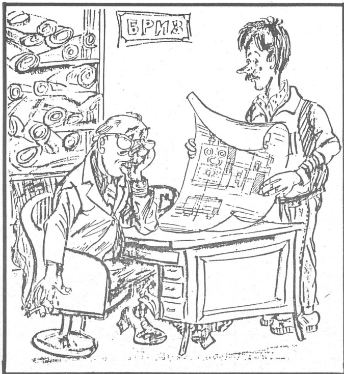
«Zu spät, junger Mann. Die Erfindung hätten Sie in Ihrer Kindheit machen müssen. Dann hätten Sie bis zur Pensionierung hinein Zeit, Ihre Idee zu verwirklichen.» (Nr. 15/85)