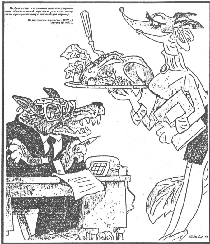
Chef: «So, so, hat es der Hase gestern gewagt, mich zu kritisieren? Er soll einmal antreten.» Sekretärin: «Er ist schon da.» (Nr. 15/85)