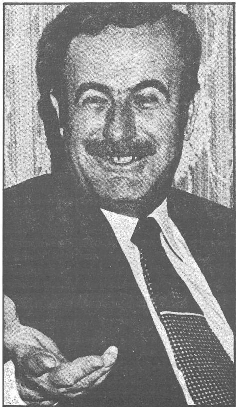
Der syrische Präsident Assad.

mischen, können sie es mit allen Fraktionen gut halten, mit den verschiedenen religiösen und politischen Gruppen und Grüppchen spielen, sie manipulieren. Der syrische Staatschef Assad steht in weit besserer Position da, solange er sich aus dem blutigen Bürgerkrieg um die Neuverteilung der Macht heraushält, und solange er dies tut, werden die einzelnen libanesischen Chefs zu ihm nach Damaskus «pilgern».