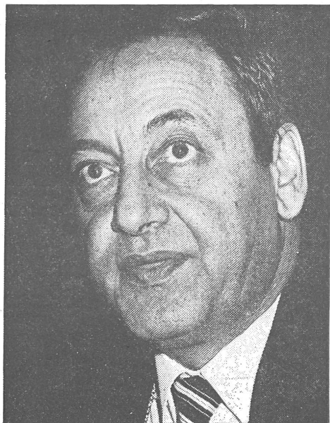
Der Amal-Führer Nahib Berri.