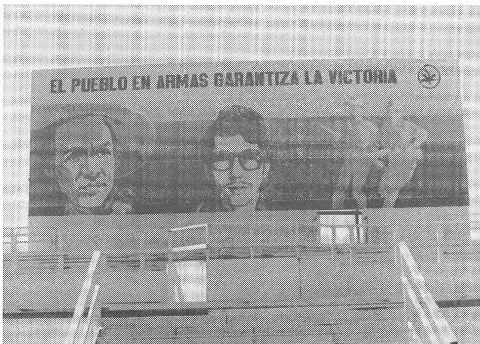
«Das Volk in Waffen garantiert den Sieg»: Propagandawand in Managua.