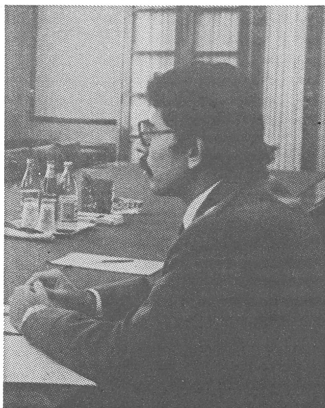
Daniel Ortega, der Präsident Nicaraguas, hier bei einem Besuch in Moskau.