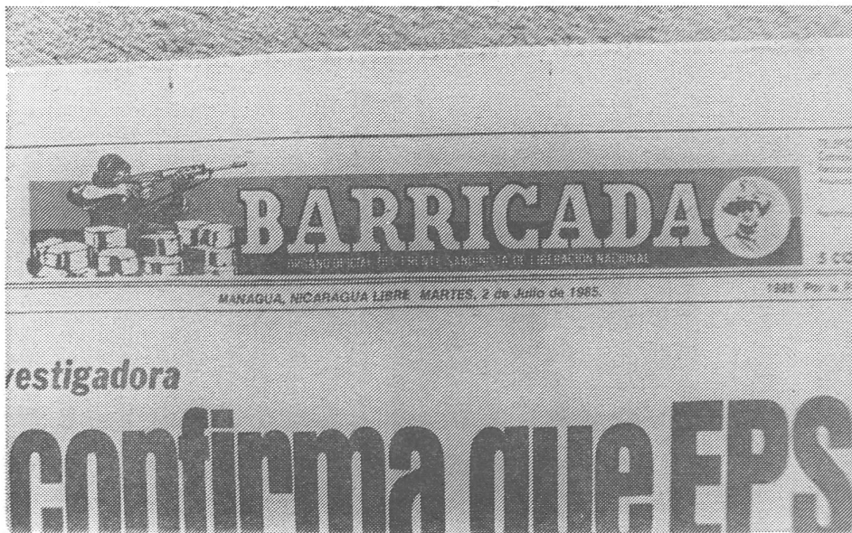
Der Kopf von «Barricada», dem Organ der sogenannten Sandinistischen Befreiungsfront.