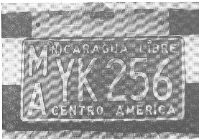
Wenigstens auf den Nummernschildern: «Freies Nicaragua».