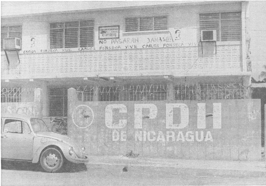
Das Gebäude der Menschenrechtskommission in Nicaragua.