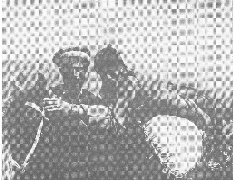
Der SOI-Hilfsfonds tut etwas für verletzte Mujahedin. Hier ein verwundeter Partisan mit amputierten Bein auf dem Weg nach Pakistan. Ein solcher Transport kann sich über Tage oder auch Wochen erstrecken.

Wer aus Afghanistan kommt, muss auch im Westen aufpassen. Die kremlgelenkte Organisation zur Tatsachenunterdrückung spielt weltweit. Auch auf dieser Ebene. ■