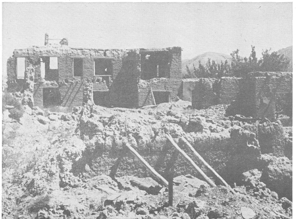
Ein zerbombtes Dorf im Jegdaley-Tal. Die Bewohner sind tot oder geflüchtet. (Alle Bilder zu diesem Beitrag von Beat Krättli, Aarau)

Das karmalische Regime in Kabul hat mit der sowjetischen Unterstützung die militärische Überlegenheit, ist aber trotzdem nicht imstande, den Widerstand zu zerschlagen. – An allen strategisch wichtigen Positionen wurden seit der Intervention von 1979 gut ausgebaute