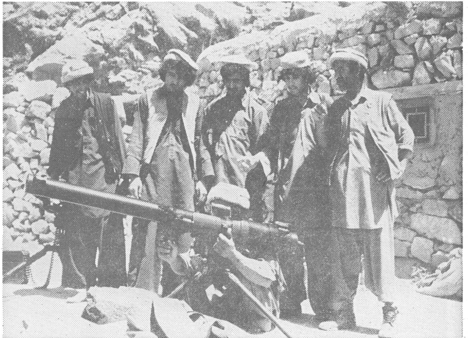
Mujahedin üben sich in der Handhabung einer rückstossfreien chinesischen 28-mm-Panzerkanone.