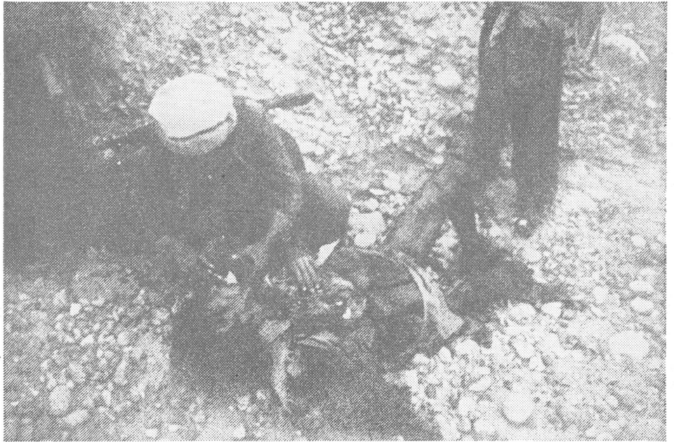
Bei der Mujahedin-Aktion gegen einen Armee-Aussenposten, bei der die beiden Schweizer dabei waren, wurde dieser Partisan von einer Tretmine verletzt und starb später.

Insgesamt aber gilt, dass die Widerstandskämpfer einem krass überlegenen Gegner gegenüberstehen. Krättli: «Verglichen mit der