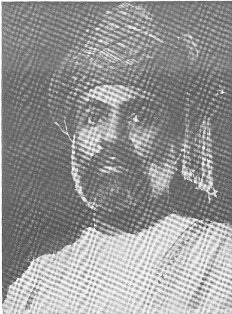
Der Herrscher von Oman.

mee (24 000 Mann, hauptsächlich von britischen InstruktorInnen ausgebildet) stolzen Nato-Standard. Oman ist heute – wie schon zu Zeiten der portugiesischen Seefahrer – ein strategischer Eckpfeiler, der aber auf eigenen Füßen stehen möchte. Deshalb setzte sich Sultan Kabus dafür ein, dass der Golf Kooperationsrat (GCC/Saudi-Arabien, Katar, Kuwait, Vereinigte Arabische Emirate, Bahrain Oman) vor der wirtschaftlichen zuerst das Schwergewicht auf die militärische Zusammenarbeit lege, dies nicht zuletzt auch mit Blick auf den Krieg zwischen dem Irak und Iran. Oman möchte sich zunächst selbst verteidigen, bevor es die eine Grossmacht zu Hilfe rief, denn «die eine würde unweigerlich die andere anziehen».