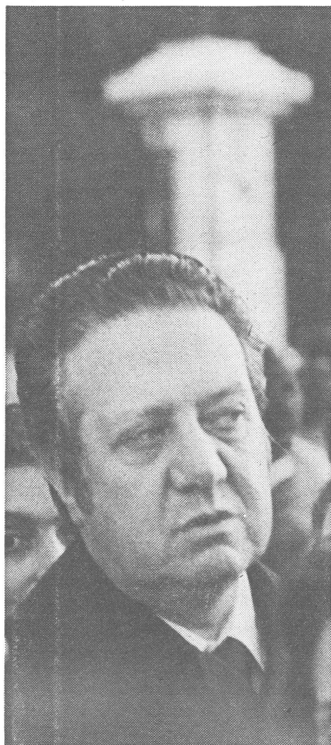
Mario Soares: Ob die da mich überhaupt noch wollen?