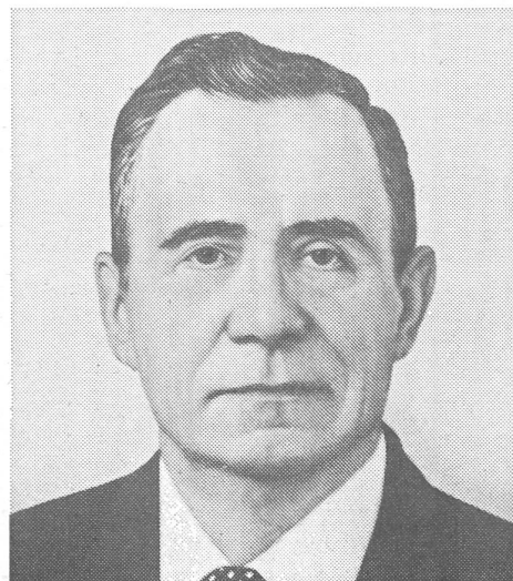
Gromyko: Staatschef spielen.

Grundsatzartikel der «Prawda» drücken den Willen der Parteiführung aus, und am 21. Juni