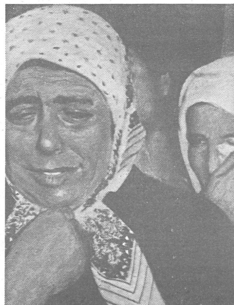
Moslemfrauen in Bulgarien.

Für die türkische Minderheit gibt es in Sofia die Zeitung «Jeni aschak», die selbstverständlich linientreu ist und war. Aber trotz ihres devoten Tones wurde sie zunächst zur Zweisprachigkeit umgestaltet, und seit dem 31. Januar dieses Jahres erscheint sie nur noch in bulgarischer Sprache.