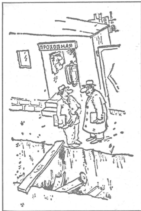
Fabrikdirektor: «Wir sind euch Leuten vom Strassenbauamt wirklich dankbar. Seit ihr hier vor zwei Jahren den Graben ausgehoben habt, sind keine Betrunknen mehr in unser Werkgelände eingedrungen.» («Ekonomscheskaja gaseta», Moskau, Nr. 27/1984)

Der Witz zielt auf die schleppenden Tiefbauarbeiten, aber nebenbei zeigt er die Plage, die man mit Betrunknen hat (wobei das «komische» Motiv ihres Abstürzens eigentlich ziemlich zynisch eingeflochten ist).