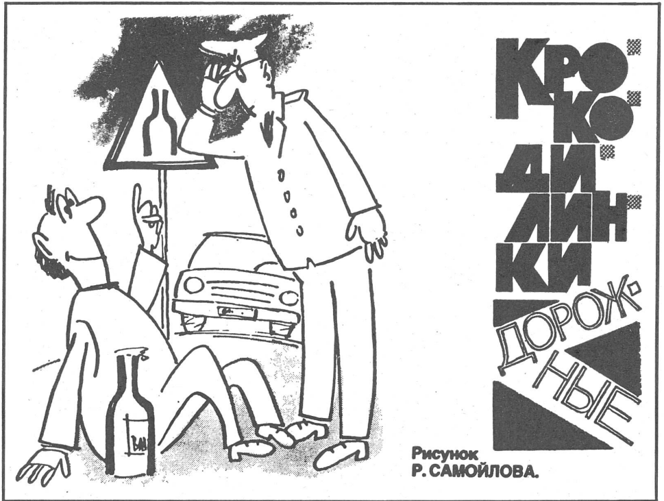
Das neue Verkehrszeichen, die Flasche. («Krokodil», Moskau, Nr. 8/1985)

Am gerichtsmedizinischen Forschungsinstitut in Moskau befasst sich eine Forschergruppe