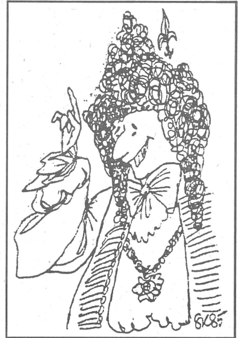
Ludwig XIV. kommt auf das Alibi der volksdemokratischen Diktatur. «Ich habe eine Idee. Von jetzt an verkünde ich: L'état, c'est vous.»

Die Botschaft liess offen, mit welchen Mitteln das am 1. Mai zum Ausdruck kommen sollte, aber die Machthaber fühlten sich angesichts der Eventualitäten offensichtlich so unbehaglich wie seit langem nicht mehr. Die vorsorgli-