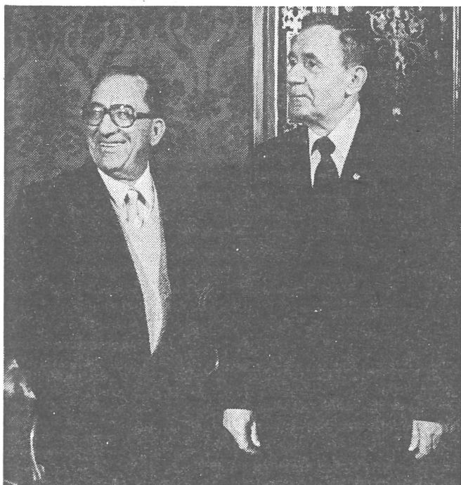
Dom Mintoff beim sowjetischen Aussenminister Gromyko im Dezember letzten Jahres in Moskau.

Marxistisch ist Malta wohl kaum (derzeit), aber Mifsud Bonnici und sein Aussenminister Alex Scerberras Trigona dürften eine noch engere Liaison zu den Sowjetblockstaaten anstreben. Bald ein «Grenada» des Mittelmeers? jb