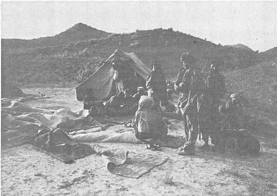
Rastplatz von Partisanen in den Bergen der Südostprovinz Pakhtia, auf 2000 m Höhe.

Sie hat die Waffen. Gleichzeitig variiert man sowohl im Basar als auch sogar in Parteikreisen