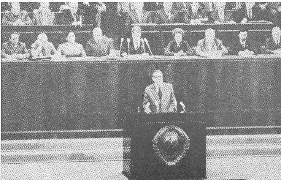
Gromyko (hier vor dem Obersten Sowjet): das neue Wort vom alten Schlag.