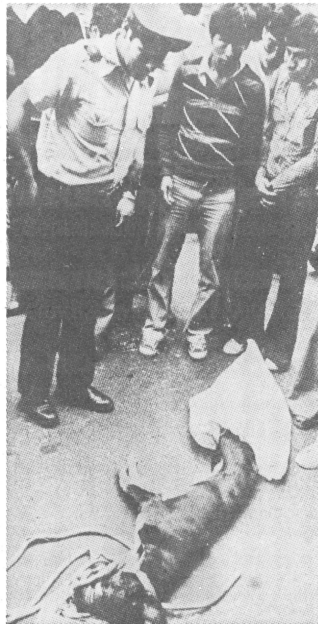
Ein Symbol der Senderisten ist der tote Hund, den sie an einen Laternenpfahl hängen. Diesen hier hat die Polizei in Lima abgeschnitten.

Die peruanischen Militärs hatten sich der Sowjetunion in den frühen siebziger Jahren «geöffnet», als sie sich von den USA sitzengelassen fühlten. Diese hatten sich geweigert, ihnen F4-Kampfbomber zu liefern. In Washington argumentierte man damals gewissenhaft, die