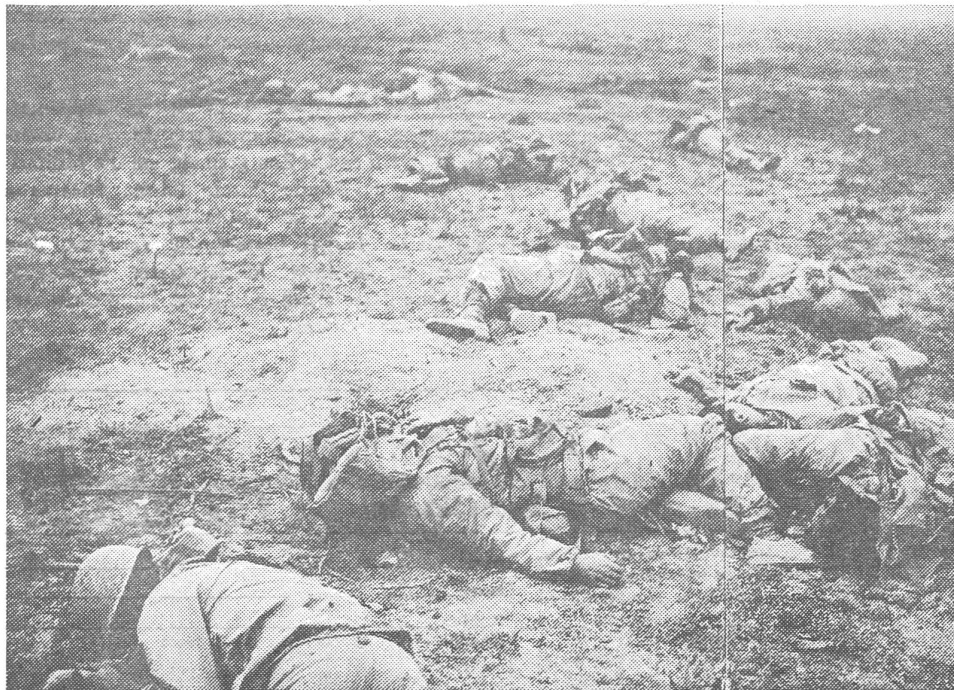
Oben: Nach einer Bombardierung. Unten und links: Die Toten auf dem Schlachtfeld.