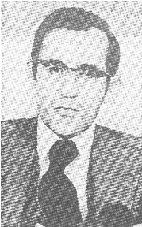
Der abtretende Staatspräsident Ramalho Eanes: mit knapp 50 Jahren noch jung genug für eine zweite Karriere als Regierungschef?

Einstweilen hat die neue Partei ihr Programm noch nicht präziser formuliert. Möglicherweise